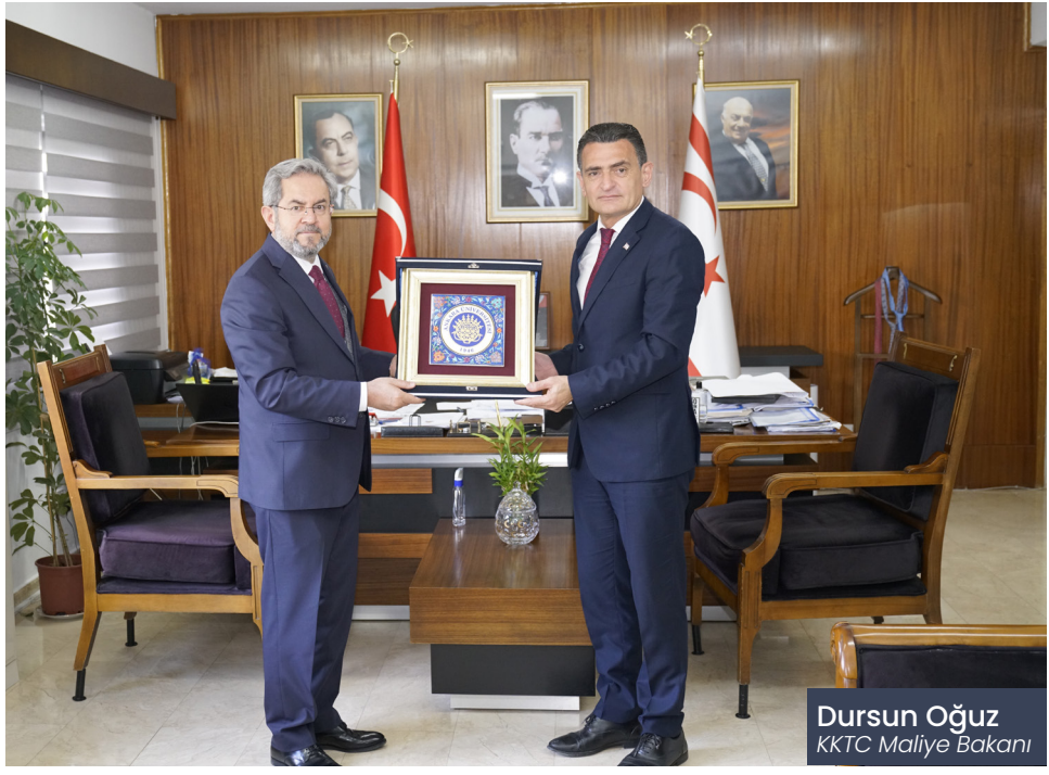
Dursun Oğuz KKTC Maliye Bakanı