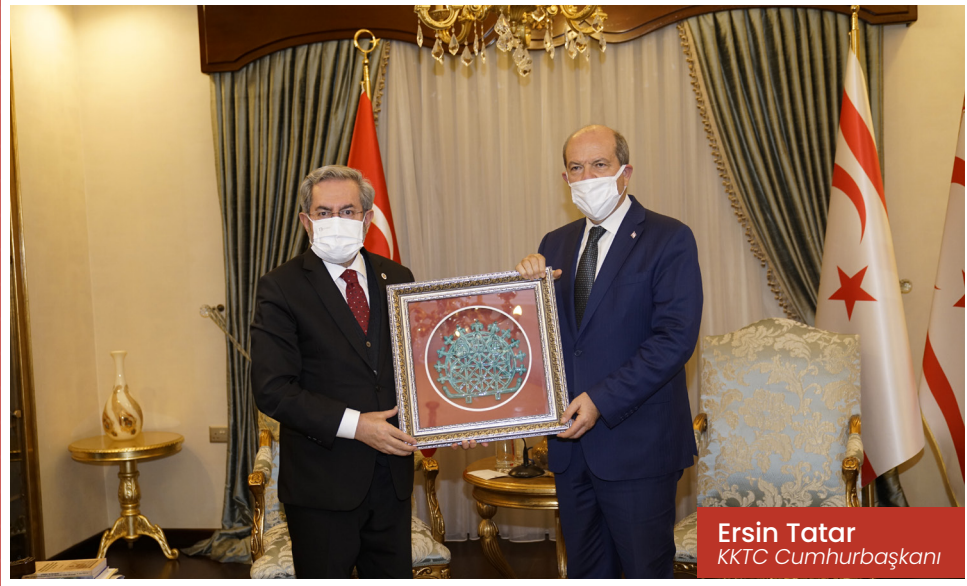
Ersin Tatar KKTC Cumhurbaşkanı