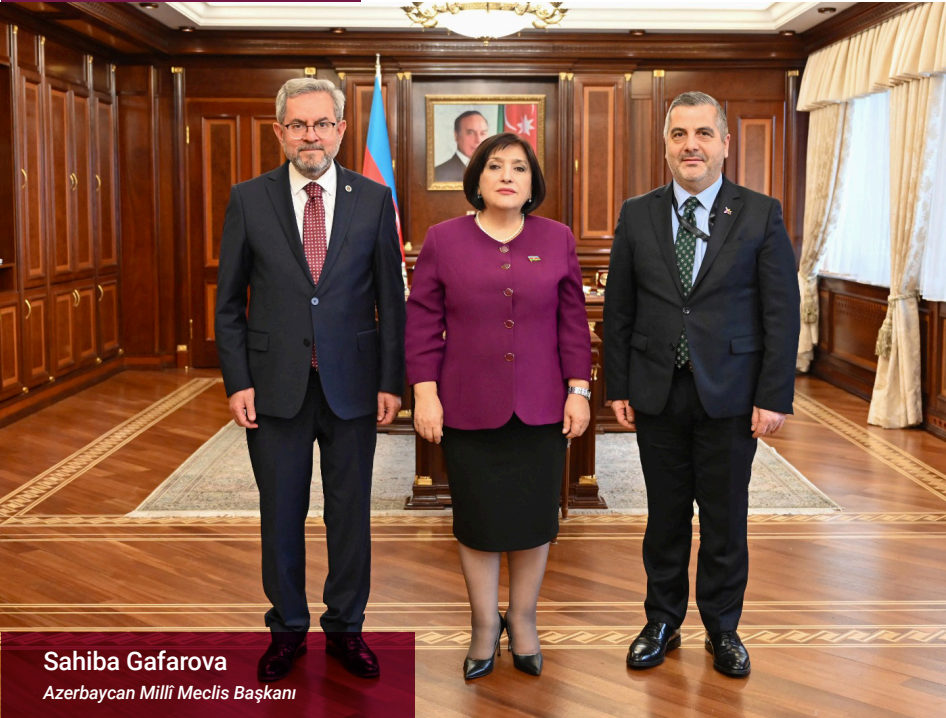
Sahiba Gafarova Azerbaycan Millî Meclis Başkanı