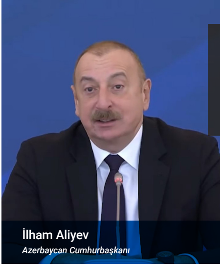
İlham Aliyev Azerbaycan Cumhurbaşkanı